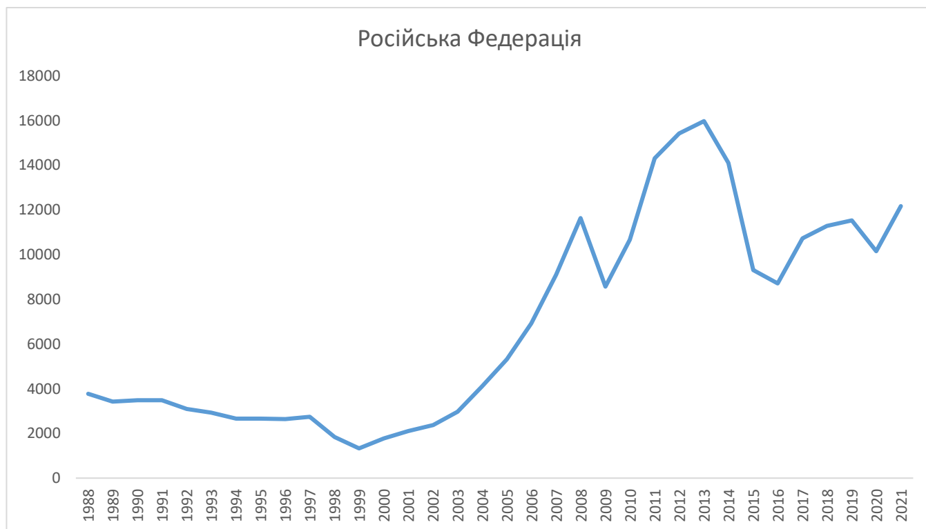
Рис.3.1 ВВП росії з 1988 по 2021 за даними Світового банку (Додаток 1)

Шість місяців тому Росія вторглася в Україну. На полі бою йде війна на виснаження вздовж тисячі кілометрів лінії фронту смерті та руйнування. Поза ним вирує ще одна боротьба — економічний конфлікт жорстокості та розмаху, якого не було з 1940-х років, коли західні країни намагаються скалічити російську економіку вартістю 1,8 трильйона доларів новим арсеналом санкцій. Ефективність цього ембарго є ключем до результату війни в Україні. Але це також розкриває багато про здатність ліберальних демократій проектувати владу в усьому світі наприкінці 2020-х років і далі, в тому числі проти Китаю. Викликає занепокоєння те, що поки що санкційна війна йде не так добре, як очіувалося.