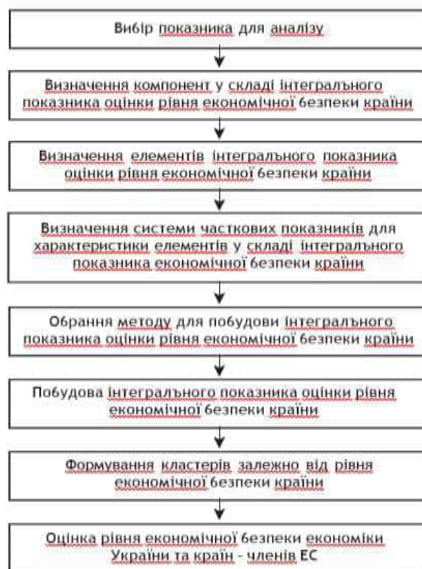
Рис. 2.1. Методичний підхід до оцінювання рівня безпеки економіки країни

використано міжнародні індекси та рейтинги). Для оцінювання рівня сформованості економічної безпеки країни були використані значення 122 міжнародні рейтинги, які характеризують безпеку країни в економічній, політичній, соціальній та духовній сферах. З метою уникнення посиленого ефекту під час розрахунку інтегрального показника безпеки національної економіки, за допомогою кореляційного аналізу була перевірена щільність статистичних зв'язків між числовими рядами за відібраними показниками, які можуть бути використані для оцінки безпеки національної економіки за кожною зі сфер: економічною, політичною, соціальною та духовною.