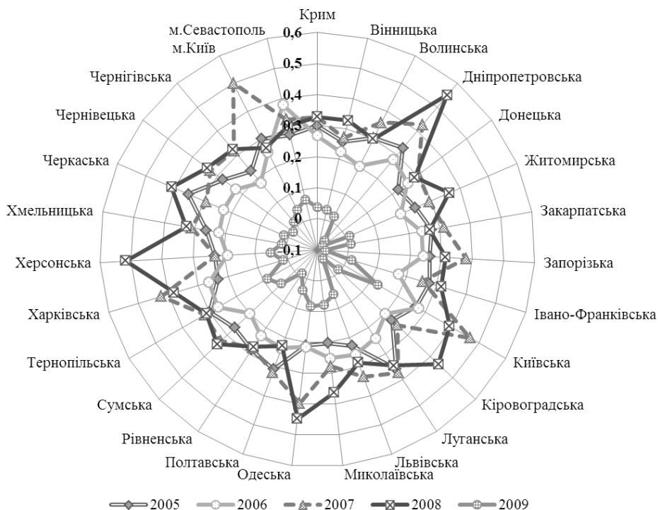
Рис. 3. Динаміка індексу структурних змін в регіонах України, 2005-2009 рр. (На основі власних розрахунків)

ринку праці, що мають на меті скорочення витрат на найм та звільнення, можуть зробити регіональний розподіл праці більш ефективним. Якість інституційної інфраструктури країни (верховенство закону і якість бюрократії, а також сприяння регіональній конвергенції) сприяє більшій ефективності впровадження вищезгаданих структурних реформ [10].