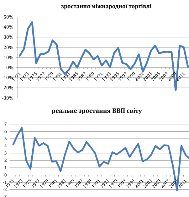
Рис. 1. Співмірність зміни міжнародної торгівлі і світового ВВП

Щодо рівня світового ВВП, то найбільша рецесія спостерігалася у 1982-1983 рр. Найнижчої